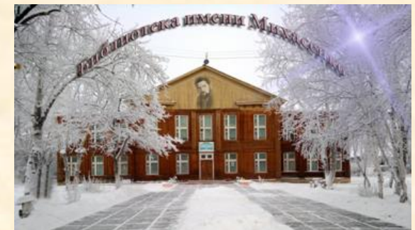
Библиотека имени Г. П. Михасенко

К 65-летию детписа (как он сам себя называл) издано собрание сочинений писателя, куда вошли уже известные и ранее неопубликованные произведения.