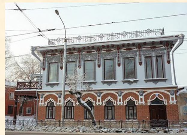
Иркутский Дом литераторов – знаменитый «дом со львами» на углу улиц Горького и Степана Разина.